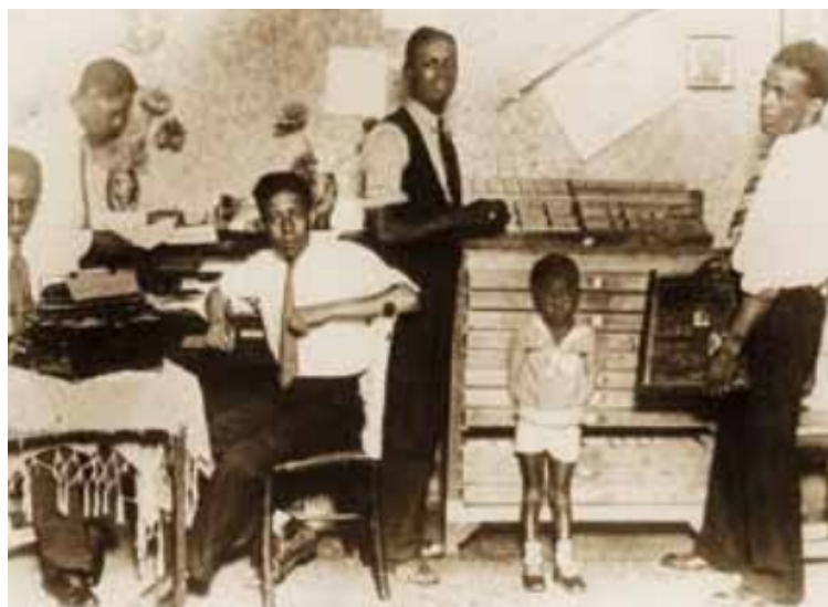
Jornal ‘O Homem de Cor’, 1833, Tipografia Fluminense.

Por isso, compreendo que, apesar de as produções jornalísticas negras por vezes conformarem formatos e reforçarem práticas defendidas pela instituição jornalística, elas não são somente uma reprodução dos modelos padrões do jornalismo com a inclusão de pautas raciais. Ao observar suas histórias e veículos, entendo que o jornalismo negro tensiona a instituição jornalística e atua também na criação de diversos modos do fazer jornalístico, por exemplo, com expressões de auto-organização quilombista. Portanto, o afeto me motiva a pensar em histórias que não são contadas e me incentiva a transformar as teorias em práticas libertadoras (hooks, 2017).